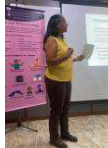
EVALUACIÓN DEL PACIENTE HISTORIA CLÍNICA Con la Dra. @alva.mariaisabel