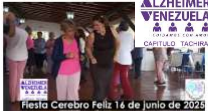
Fiesta Cerebro Feliz 16 de junio de 2025