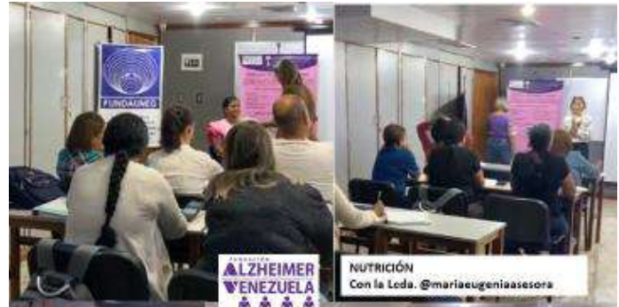
NUTRICIÓN Con la Leda. @mariaeugeniaasesora