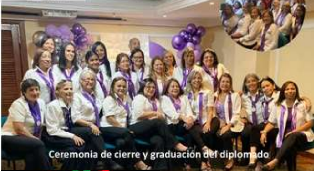
Ceremonia de cierre y graduación del diplomado